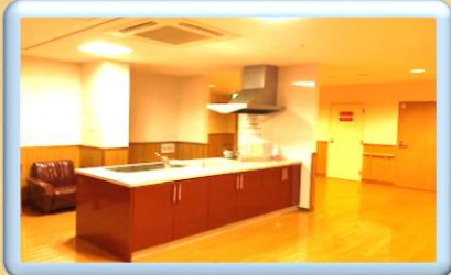
キッチン（各階に配備）