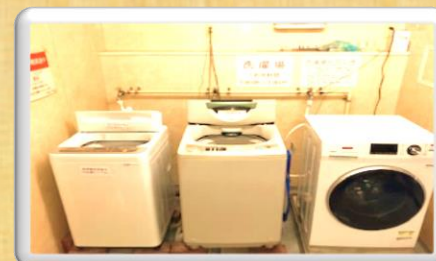
洗濯室(各階に配備)