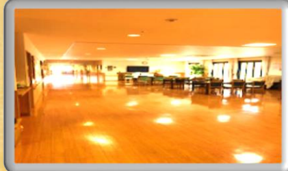
各階 リビング風景