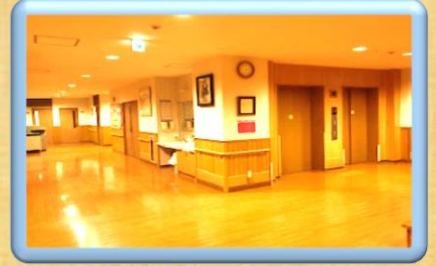
1階 エレベーターホール