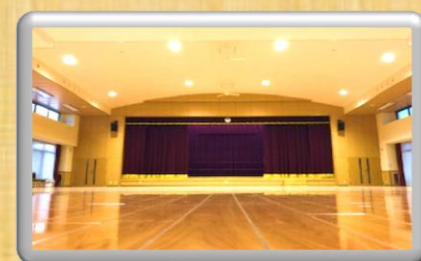
レインボーホール