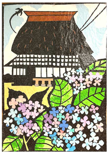
ちぎり絵「雨 晴れて」 制作：養護ご利用者

こんな「間」もあるんだなと仕事をしながら勉強させられたと感激の一コマだった。これも悪い日と良い日の間かもしれない。