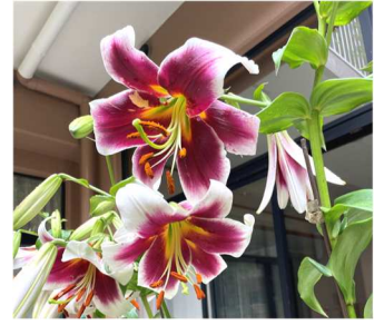
中庭のカサブランカ