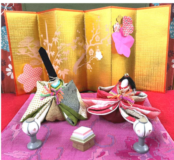
職員のご家族様 制作