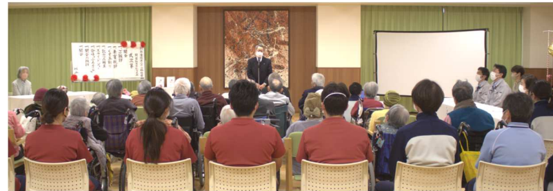
ひまわりホールにて

記念式典では、ご利用者・職員に記念品の贈呈、スクリーンに映った写真を見ながら30年を振り返り、ご利用者・職員一緒にお祝いました。