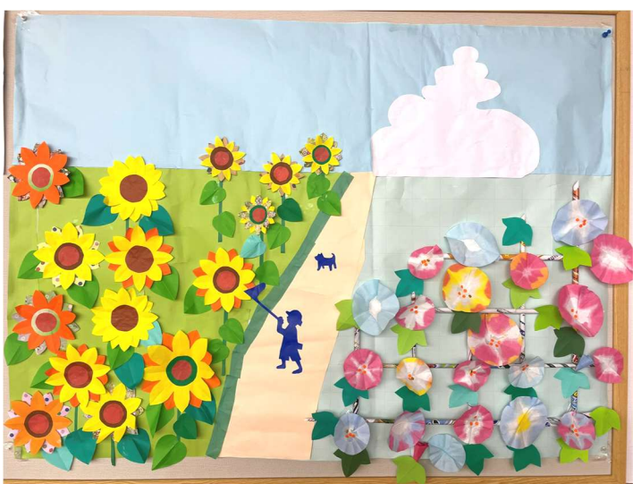
特養ご利用者合作