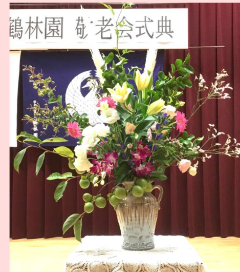
園庭の花や柿、栗等を使い、ご利用者と職員で生けました!

ご利用者の中には「まだまだ自分は若いで〜!」と笑いながら話される方もいらっしゃいました。