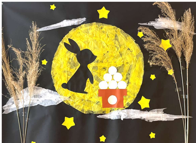
特養職員制作 壁画「お月見」