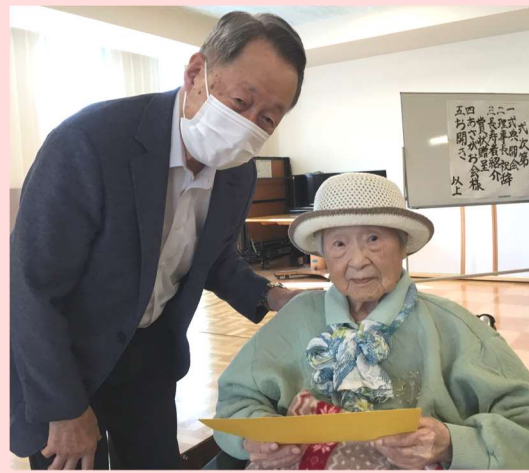
仲良し2人組(^^) 98歳、100歳ご利用者