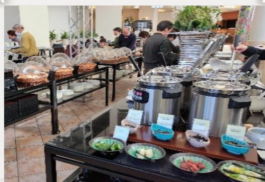
ご馳走がいっぱい!