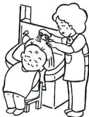
身体的清拭・洗髪