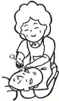
身体整容 (爪きり・耳かき・髪を梳くなど)